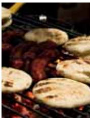
Arepa con chorizo

De la diversidad de fauna y flora en Colombia surge una variada gastronomía esencialmente criolla, con poca influencia de cocinas extranjeras. Los platillos colombianos varían en preparación e ingredientes por región e incorporan las tradiciones de las culturas española, indígena y negra. Algunos de los ingredientes más comunes en las preparaciones son cereales como el arroz y el maíz, tubérculos como la papa y la yuca, variedades de leguminosas (frijoles), carnes como la de vaca, gallina, cerdo, cabra, cuy y otros animales silvestres, pescados y mariscos. Es importante también la variedad de frutas tropicales como el mango, el banano, la papaya, la guayaba, el lulo y la maracuyá.