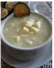
Mote de queso